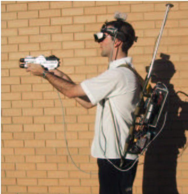
Kuva2: ARQuaken pelaaja täydessä varustuksessa(Thomas et al. / University of South Australia, 2002)

Lisätty todellisuus (Augmented Reality (AR)) tarkoittaa tässä tapauksessa tietokonegrafiikan heijastamista normaalin näkymän päälle siten, että heijastetun grafiikan voisi kuvitella kuuluvan näkymään.